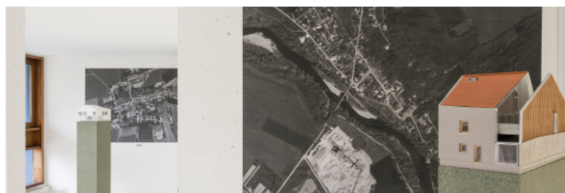
Gens, Rusticité .